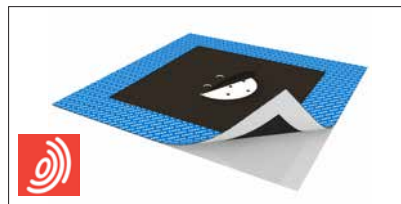
En patenteret løsning