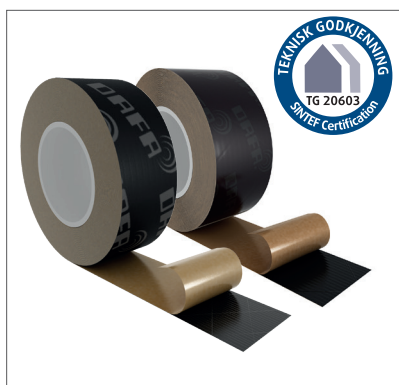
DAFA UV tape.